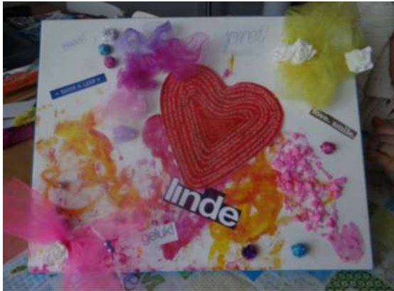
Voorbeeld 'moodboard' gemaakt door cliënt

Liefst draagt de cliënt het communicatiepaspoort bij zich als hanger, als gesprekskaart, boekje op de rolstoel of als fotoboekje in een app op de tablet (via bv. Pictello-app). Als cliënten een versie op een elektronisch hulpmiddel opslaan, moet er altijd ook een fysieke of geprinte versie beschikbaar zijn (voor het geval de apparatuur niet werkt).