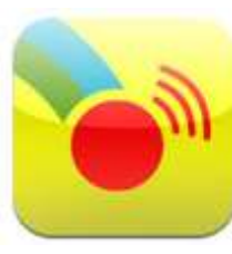
Scene and Heard

Bij een communicatiepaspoort stelt het kind zichzelf kort voor met behulp van de best passende communicatieondersteuning. Het communicatiepaspoort informeert communicatiepartners over zijn of haar leven, diens persoonlijkheid, de eventuele bijzonderheden zoals hulpvragen of in geval van nood de wijze van contact maken en communiceren en de interesses van de cliënt.