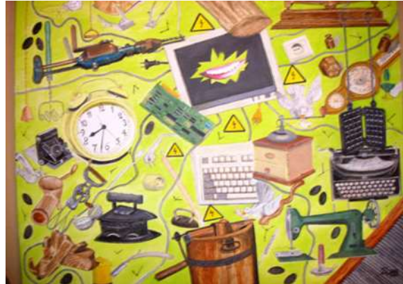
Voorbeeld van een moodboard samen gemaakt met cliënt en omgeving

Het communicatiepaspoort geeft ook informatie over de manier waarop met de houder een gesprek gevoerd kan worden en wat te doen in geval van nood (ICE: In Case of Emergency). In het communicatie-paspoort staat informatie over mogelijke gespreksonderwerpen (bv. 'Wat vind ik leuk of niet leuk?', 'Waar woon ik?', 'Hoe heet ik?', 'Wat doe ik?', enzovoort). Het communicatiepaspoort drukt expliciet en op eigen wijze uit dat iedereen recht heeft op toegankelijke communicatie en dat de directe omgeving daar zo optimaal mogelijk ondersteuning bij moet kunnen bieden. Het communicatiepaspoort kan ook digitaal als een soort portfolio gemaakt worden op tablet pc (bv. iPad) met speciale Apps zoals 'Pictello', 'StoryCreator' of 'Scene&Heard'