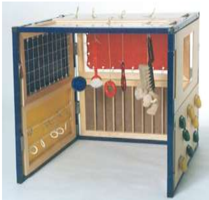
Voorbeeld 'Little Room' Paspoort